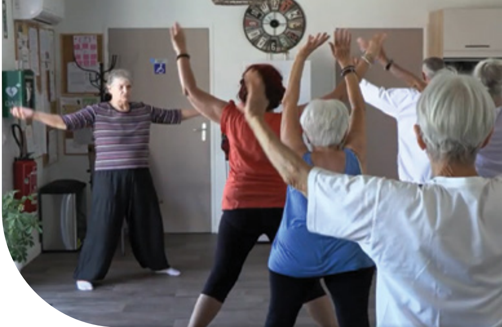
Qi Gong au béguinage de Paray-le-Monial