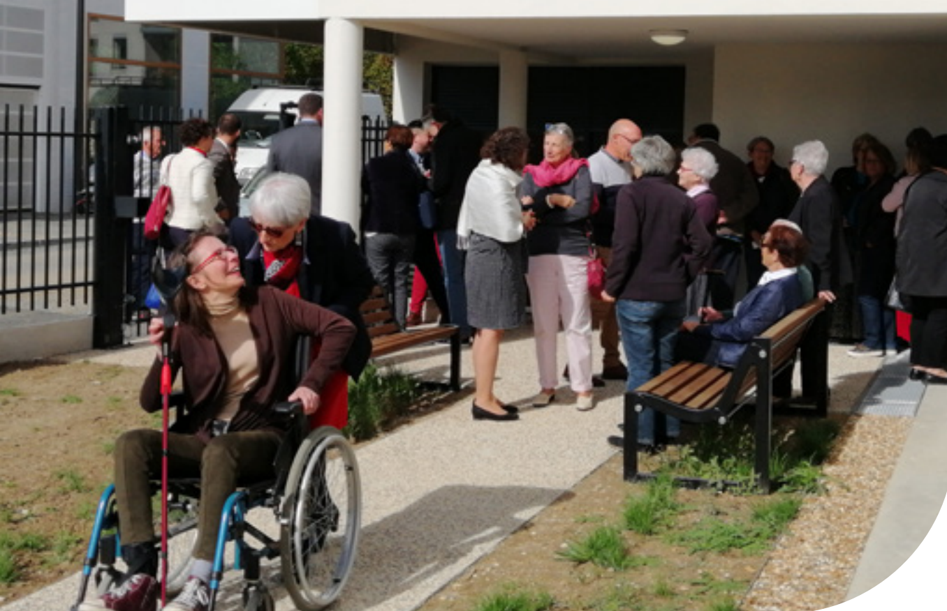
Inauguration du béguinage de Tours - Oct 2019