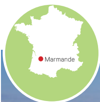
Vue de la ville de Marmande

Avec plus de 110 associations actives, Marmande offre un tissu associatif riche et diversifié. Entraide, loisirs, sport, culture, arts ou enseignement : vous y trouverez certainement des activités qui vous ressemblent, que vous souhaitiez simplement participer ou vous engager plus activement dans la vie locale.