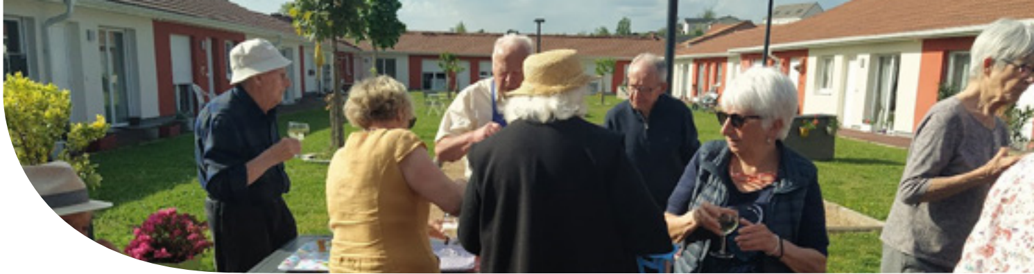
Vernissage d'une exposition au béguinage de Paray-le-Monial