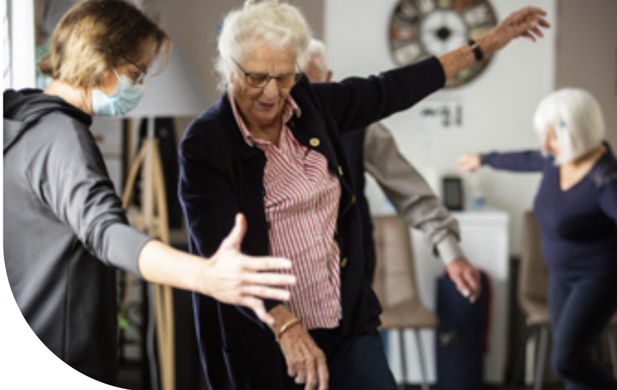
Atelier Équilibre, béguinage de Paray-le-Monial