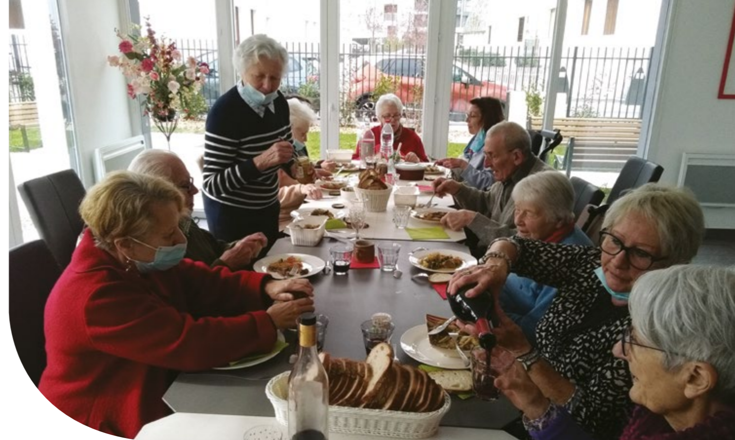
Repas solidaire pour les Restos du Coeur dans la salle de convivialité du béguinage de Tours