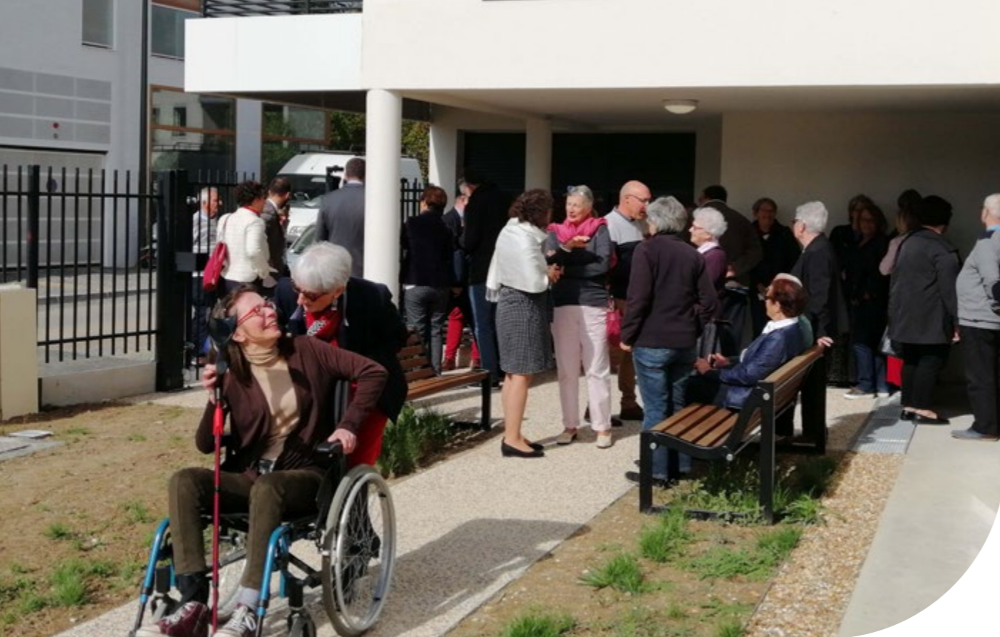
Inauguration du béguinage de Tours - Oct 2019