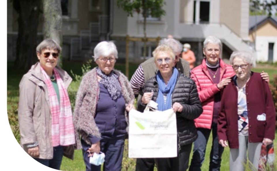
Résidentes du béguinage de Mûrs-Érigné