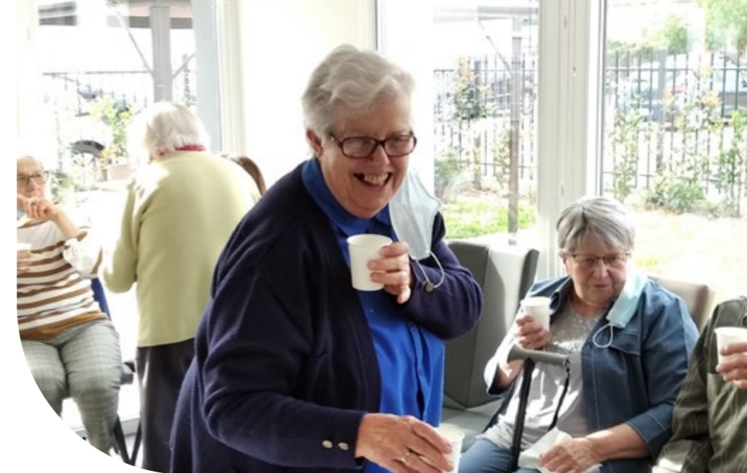
Pizza Party avec l'association Vivre en Béguinage - Béguinage de Tours