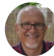
PRÉSIDENT Christophe BAIOCCO